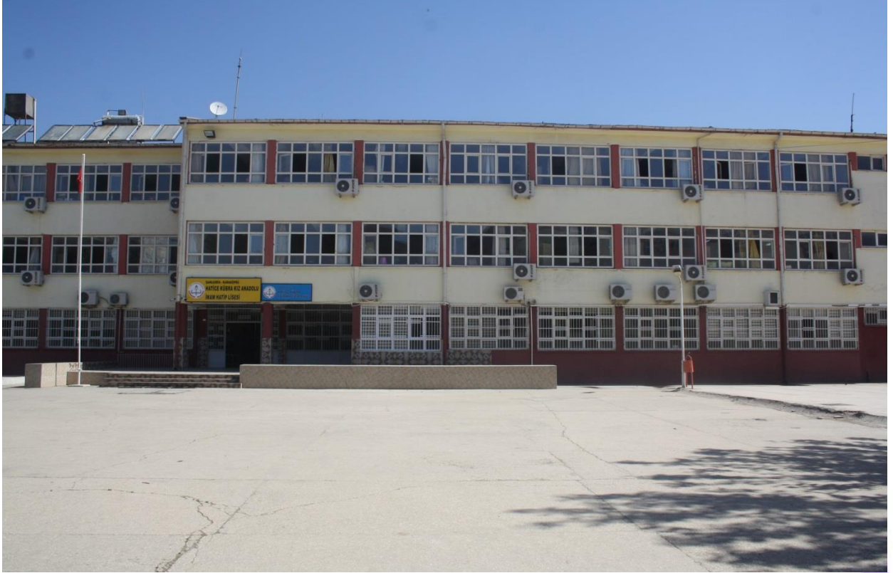
Ana Giriş Kapısı